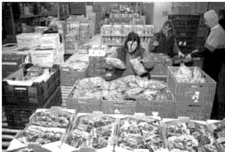
De voedselbank in Eindhoven.